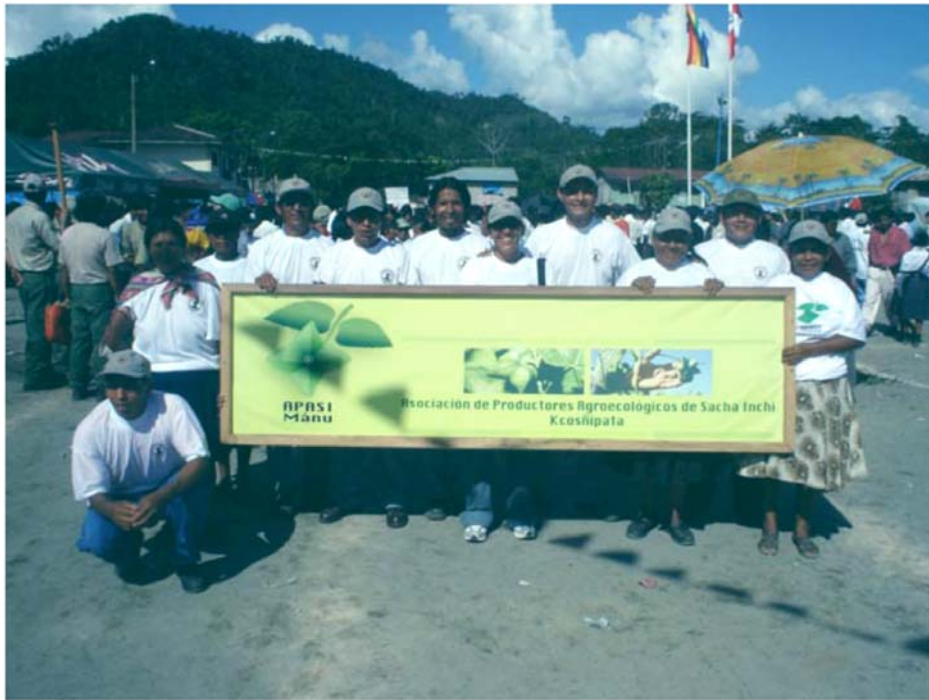
INTEGRANTES DE LA ASOCIACION "APASI MANU" EN EL DESFILE POR EL ANIVERSARIO DEL DISTRITO DE KCOSÑIPATA