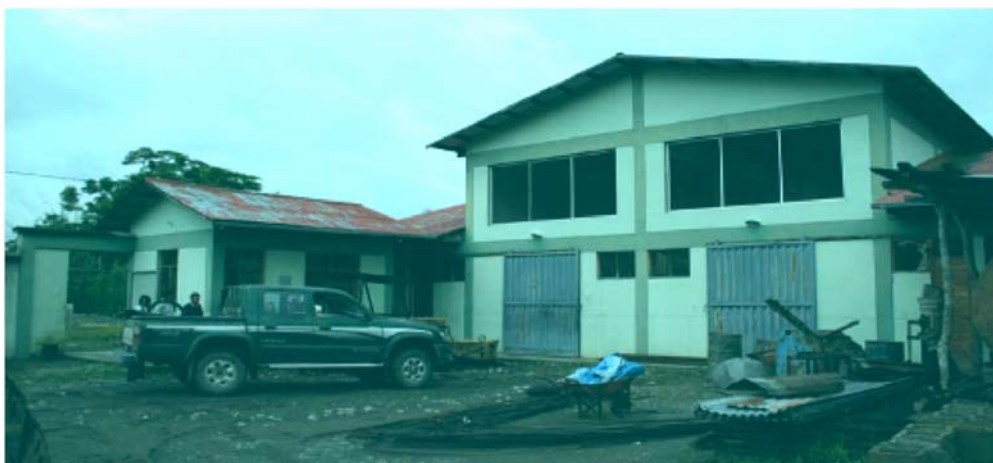
Centro de Acopio Municipal para el Sacha Inchi en Pilcopata.

Dentro de la cadena productiva del "Sacha Inchi" es indispensable el centro de acopio, para seleccionar, estandarizar, empacar y transportar el grano con el fin de facilitar su comercialización: