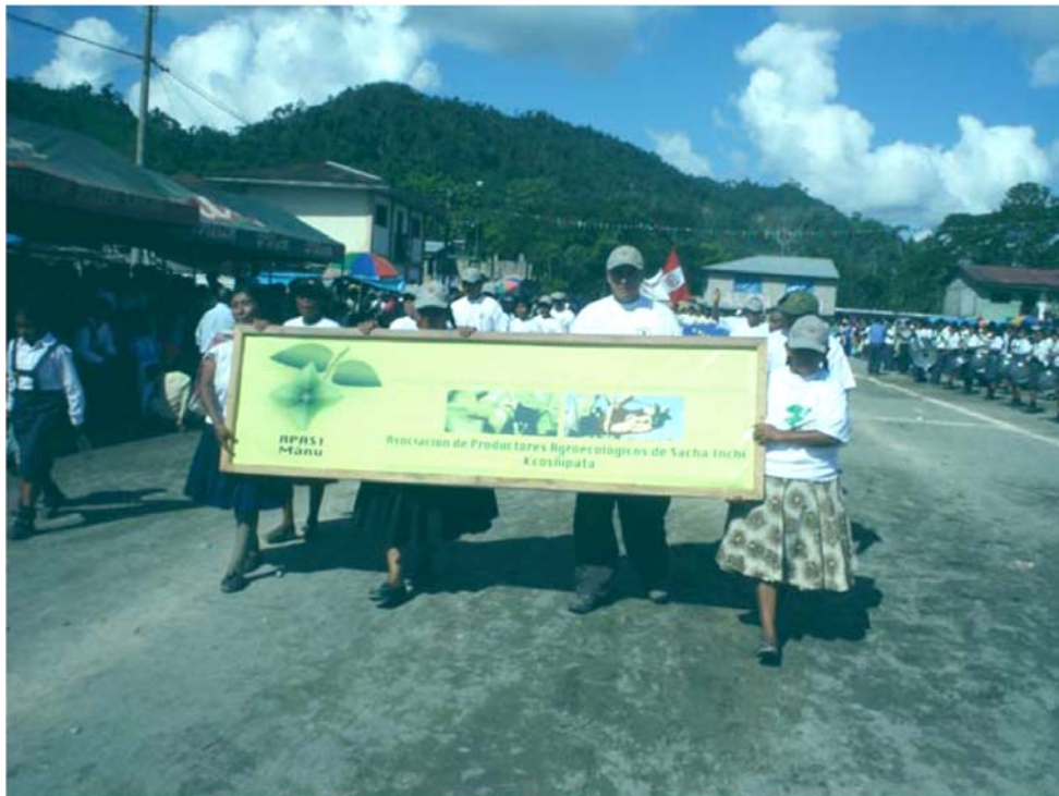
INTEGRANTES DE LA ASOCIACION "APASI MANU" DESFILANDO POR EL ANIVERSARIO DEL DISTRITO DE KCOSÑIPATA