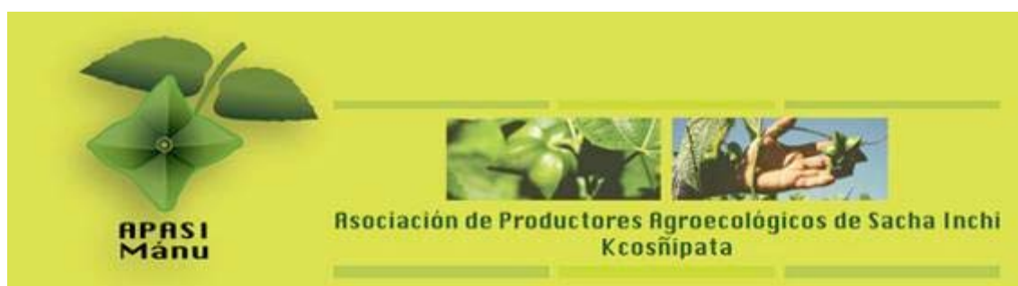
PANEL "APASI MANU"

Estos productos fueron utilizados en la organización, y planificación publicitaria del puesto o stand de promoción de APASI Manu en la Primera Feria Agropecuaria, Artesanal y de Turismo organizada por la municipalidad del distrito de Kcosñipata y la sede agricultura del sector, cuya premiación adjudicó el primer lugar a los asociados de APASI MANU. El stand fue apreciado por las autoridades de la municipalidad y el presidente del Gobierno Regional del Cusco, Sr. Hugo Gonzáles Sayán.