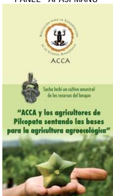
BANNER "APASI MANU"