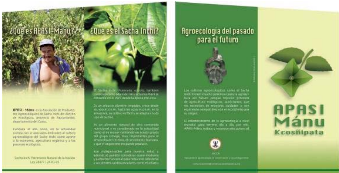
BIFOLIO "APASI MANU"